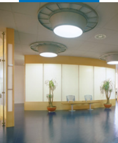
Esempi di posa di quadrette in gomma con Ultrabond Eco Fix - IBM Center - Spagna