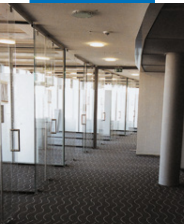
Moquette posata in uffici postali con Ultrabond Eco Fix - Post Tower - Italia